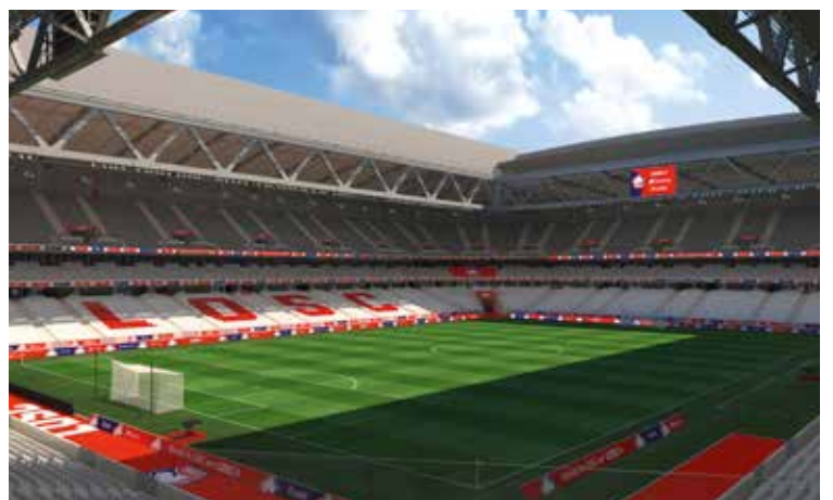
Vue de vos sièges