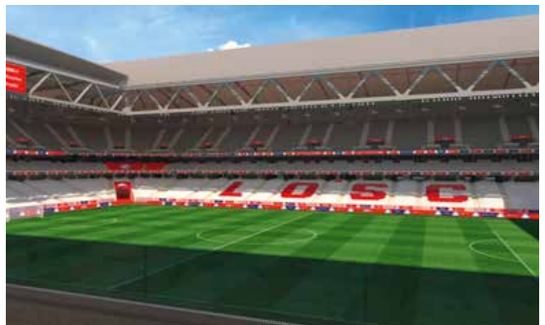
Vue de vos sièges