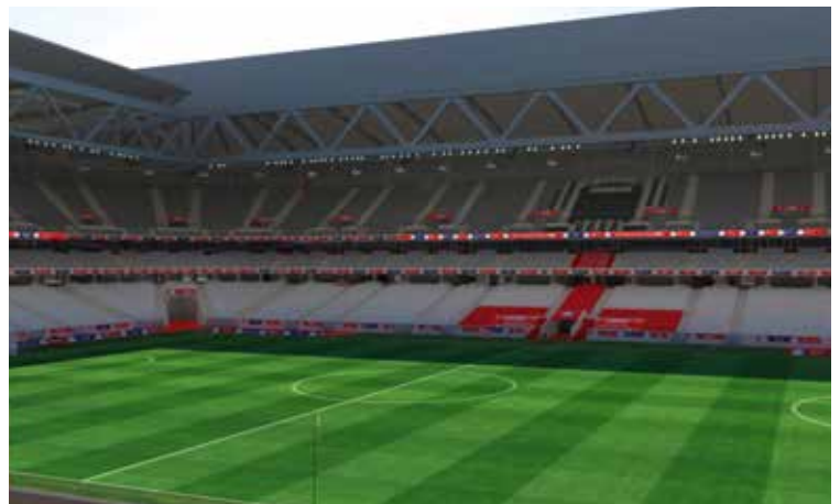
Vue de vos sièges