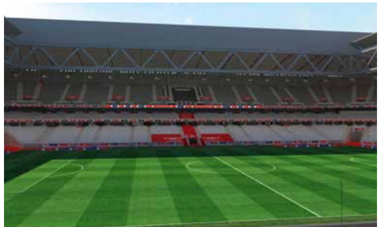
Vue de vos sièges